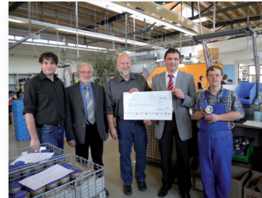
Das 10jährige Jubiläum der Zusammenarbeit war im April 2010 Anlass für eine Spende der LW an die WEK in Kirchheim