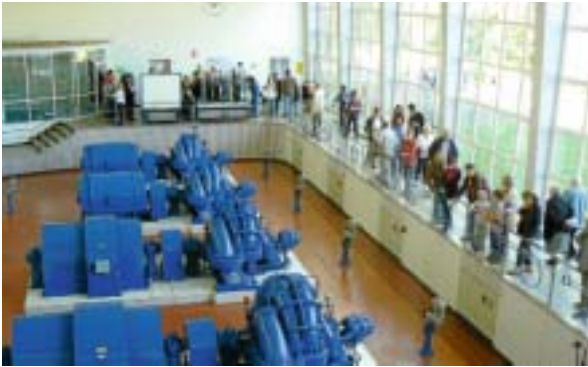
Ein bleibendes Erlebnis – die Besichtigung eines Wasserwerkes.

Presse, Radio und Fernsehen in Form von Einzelgesprächen, Presseinformationen, Pressekonferenzen, Interviews oder Unternehmensporträts unterstützt den Öffentlichkeits-