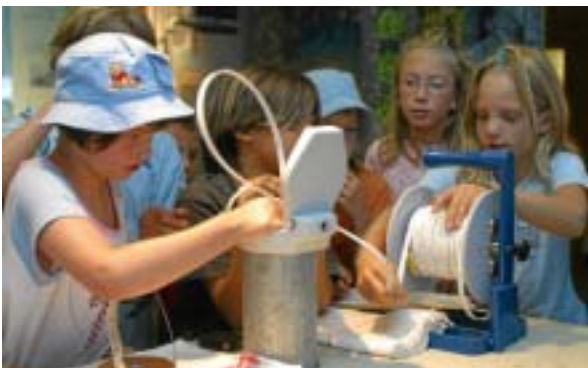
Erlebnisswelt Grundwasser – eine Erlebnisreise in die Welt des Grundwassers.

wirksamen Unternehmensauftritt. Die Zusammenarbeit von LW und öffentlich-rechtlichen und privaten Medien wurde vor diesem Hintergrund fortlaufend ausgebaut. Als Multiplikatoren gewährleisteten sie, dass drei Millionen Bürgerinnen und Bürger, die das Trinkwasser der LW in weiten Teilen Baden-Württembergs erhalten, über die wesentlichen Dinge der Wasserversorgung umfassend und zeitnah informiert werden.