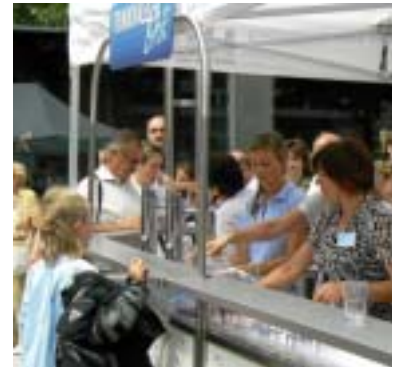
Lebendige Öffentlichkeitsarbeit – mit der Trinkwasserbar unterwegs.

Von einer nicht zu unterschätzenden Bedeutung ist die Information der Mitarbeiter des Unternehmens. Sie trägt zum besseren Verständnis für die tägliche Arbeit bei und wirkt motivationssteigernd. Besprechungen, Mitarbeitergespräche, Aushänge, Betriebszeitungen und das Intranet stehen dafür zur Verfügung. Gespräche und das Intranet stehen bei der LW im Vordergrund.