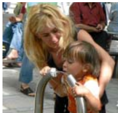
Trinkwasserbrunnen auf der Oberen Königstraße.

Anzahl und Vielfalt der Medienbausteine haben dazu geführt, dass sich die Landeswasserversorgung in den Augen ihrer Kunden, ihrer Geschäftspartner und der Medien über die Jahre hinweg als kompetenter Ansprechpartner zu allen Fragen der Trinkwasserversorgung positionieren konnte. Sie hat ihren Bekanntheitsgrad gesteigert und sich ein durchweg positives Image zugelegt – eine gute Grundlage für die Kommunikation verschiedenster Themen.