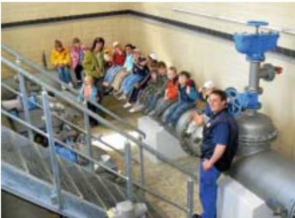
Naturwissenschaft und Technik – schon die Kleinsten lassen sich begeistern.